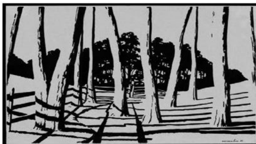
А. Антонович «Зимний день»