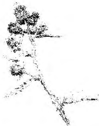
Александр Добровольский «На колкем снегу»

уже под утро нахожу слова – опали листья