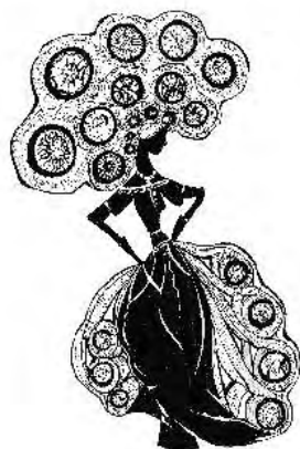
Софья Рэм “Бигуди”

Как все кошатники, я знаю это. Как и то, что птицы так летать не могут.