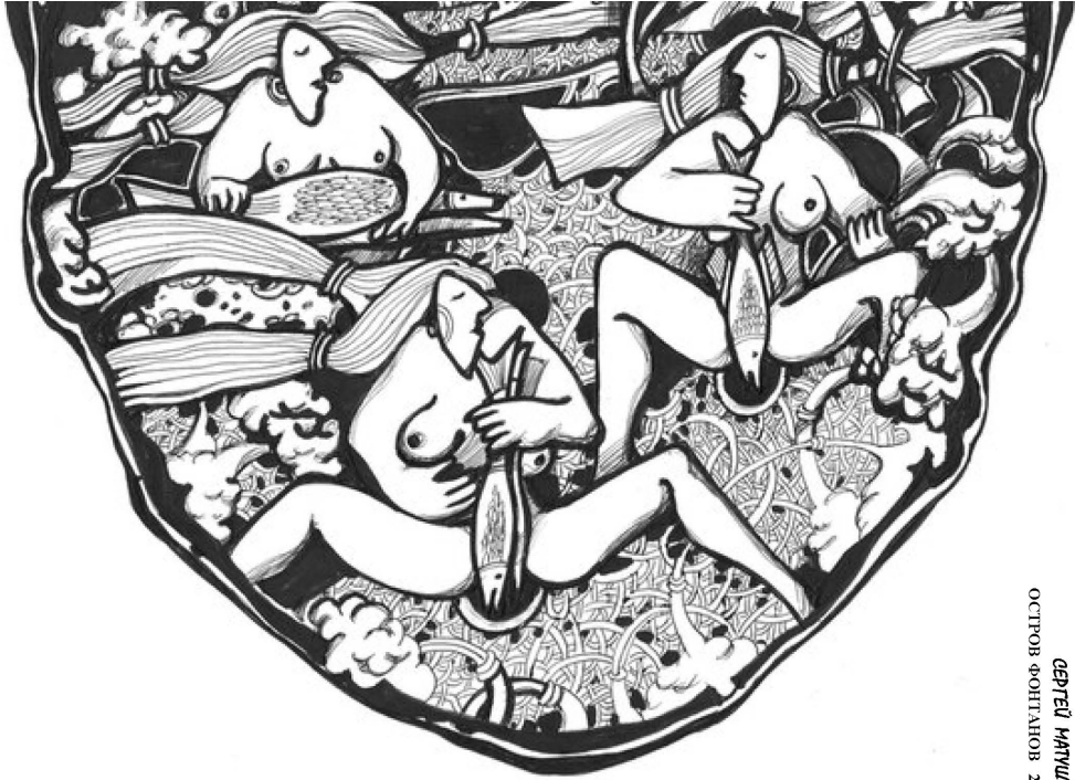
ГЕРТЮ МАТЮКИН ОКТОБРЬ ФОНТАНОР 2013