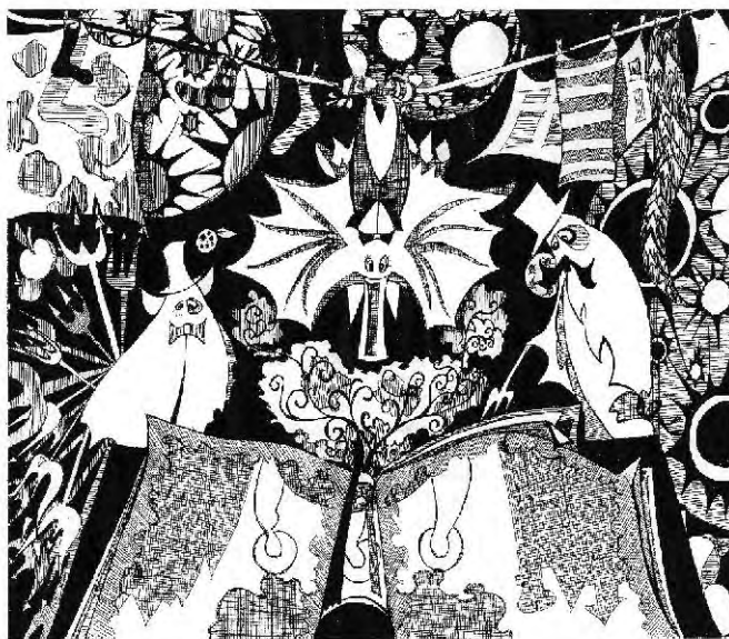
Софья Рэм “Вселенная”

– Белоснежка! – мрачно ответила девушка.