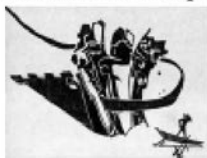
Рис. И. Карасева “Тень”