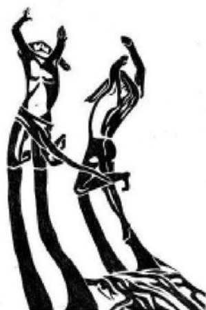
Рис. И. Карасева “Марионетки”

Мой домик, свитый из перьев кецалья, Из жёлтеньких перьев птички-трупьяла, Мой домик, сплётённый из веток коралла, Покину я вскоре. Ай, какой я! Ай-ай-ай!