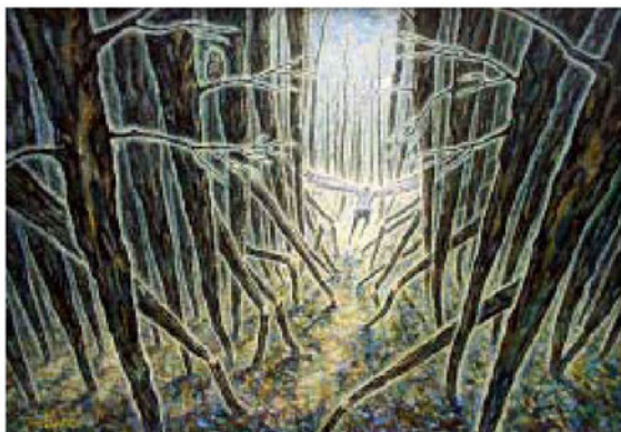
карт. А. Левченко “Полнолуние”