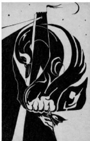
Рис. И. Карасева “Лебедь”