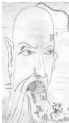
Рис. И. Кротова “Хула”

Миниатюрность формы японского сонета вроде бы вызывает к самодостаточности. В десяти строчках можно сказать всё. Но пресловутая величественность содержания вызывает к продолжению и отражению одного в другом и к выстраиванию связей второго порядка, образующих некий свертхтекст. Отсюда - интуитивная тяга к созданию циклов или диалогических цепочек. Процесс может быть почти бесконечным, поскольку