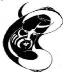
Рис. И. Карасева

Чужое око иногда подобно железным оковам.