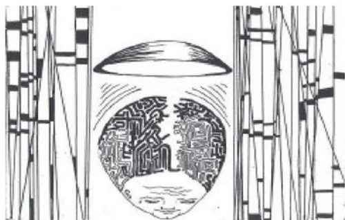
Рис. И. Бедросовой

Засыпал он плохо. А когда заснул, ему приснились неслучившиеся неприятности.