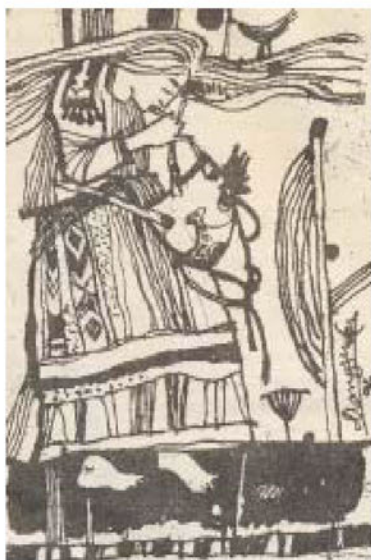
Рис. С. Матушкина “Музыка для глаз”

Тем более краткость востребована русскоязычными авторами сейчас, в век Интернета. Как говорится: «краткость – сестра таланта». Давайте же убедимся в этом сами.