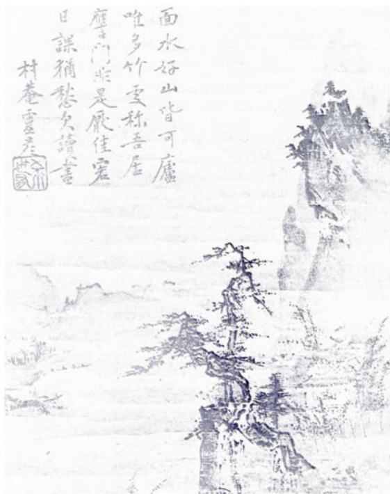
Сюбун (приписывается). Отпельник в горной хижине. Фрагмент свитка XVв.

Однажды нанесённые мазки не могут быть смыты, нанесены заново и не подлежат дальнейшим поправкам или доделкам. Любой мазок, нанесённый позже, резко и болезненно выделяется вследствие специфических свойств бумаги. Художник должен постоянно, всецело и произвольно следовать за своим вдохновением. Он просто позволяет ему управлять его руками, пальцами и кистью, будто они вместе со всем его существом являются всего лишь инструментом в руках кого-то другого, кто временно вселился в него. Можно сказать, что кисть выполняет работу сама, независимо от художника, который просто позволяет ей двигаться, не прилагая никаких сознательных усилий. Если между кистью и бумагой появится какая-либо логическая связь или размышление, весь эффект пропадает. Так рождается сумиё . Нетрудно догадаться, что линии в сумиё должны проявлять бесконечное разнообразие. Здесь нет никакого распределения светотени и никакой перспективы. Они, фактически, не нужны в сумиё : здесь нет никакой претензии на реализм.