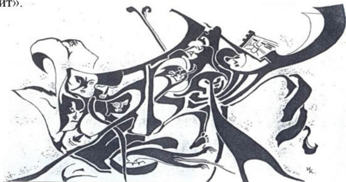
Рис. И. Карасева

Год спустя, когда Петр Филиппович охотился с друзьями на уток, чья-то пуля поразила его в сердце. Разом вся жизнь его прошла перед глазами. И жалел он лишь об одном, что не сможет уже написать на той бумаге, которая хранится в его заветном ларце: «Эта пуля, которой я был убит».