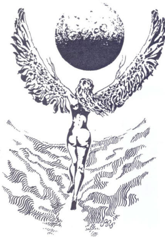
Рис. В. Калиниченко