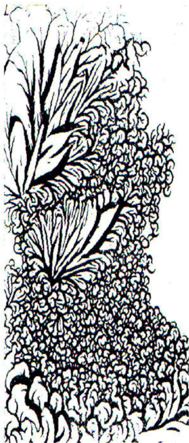
И. Кротов. Компьютерная графика.