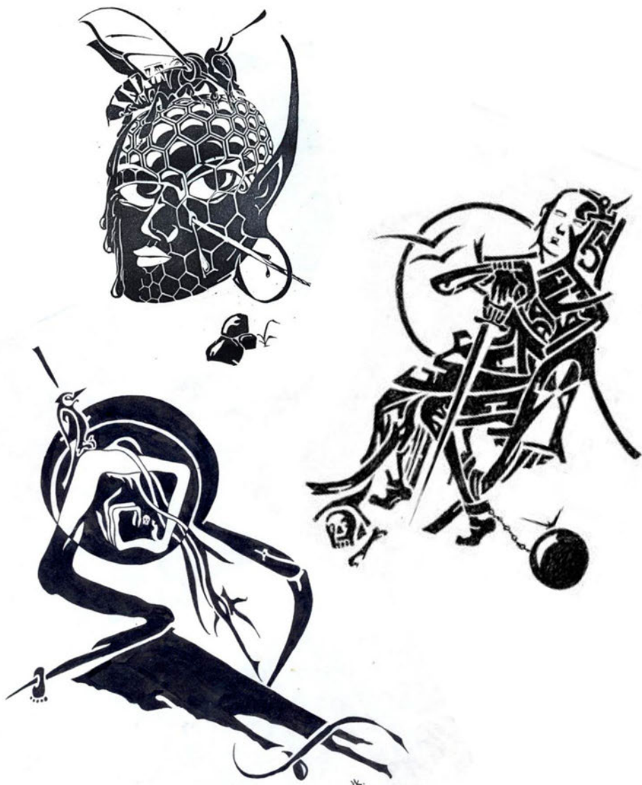
Рисунки И. Карасева