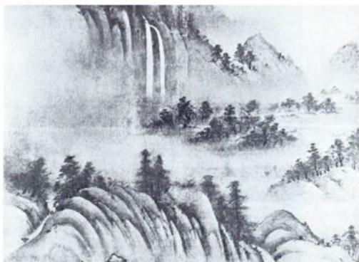
Соами. Времена гола. 1513г.