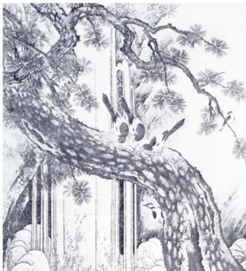
Кано Мотонобу. Водопад. Фрагмент росписи. Начало XVI в.

В данной статье автор не ставил своей задачей критику образов и характеров основных героев японской литературы. Целью являлось краткое ознакомление культурного субстрата, давшего истоки художественному мышлению японцев. Автор выражает надежду, что его краткий и весьма схематичный обзор найдет отклик у читателей, и, возможно послужит поводом для обмена мнениями.